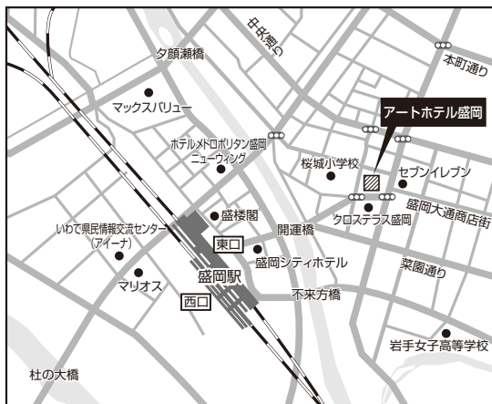
■盛岡会場：アートホテル盛岡