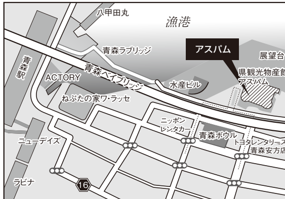
■青森会場：青森県観光物産館アスパム

【アクセス】○JR仙台駅西口 徒歩2分 ○JR仙石線「あおぼ通」 徒歩5分 ○地下鉄南北線「広瀬通」 徒歩5分